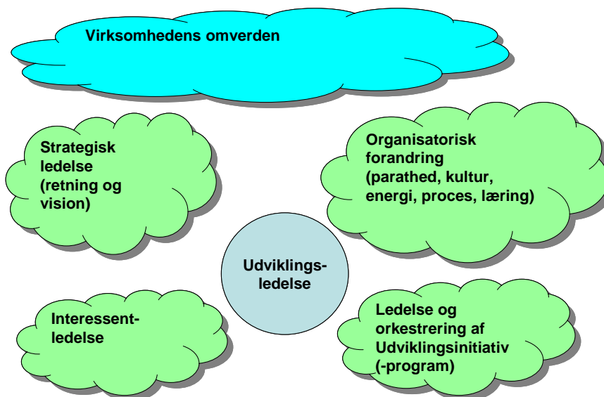
Figur 4: Udviklingsledelsens kontekst